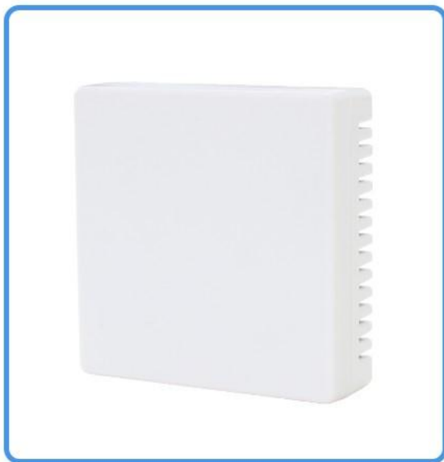
大气压力传感器 (无转换器 无信号线)