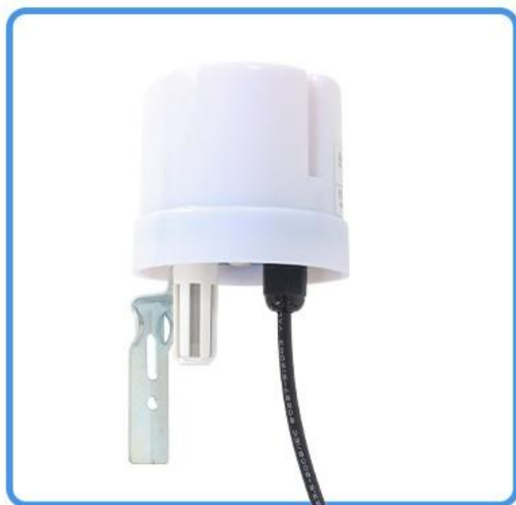
户外光照温湿度传感器 (不含电源 不含转换器)