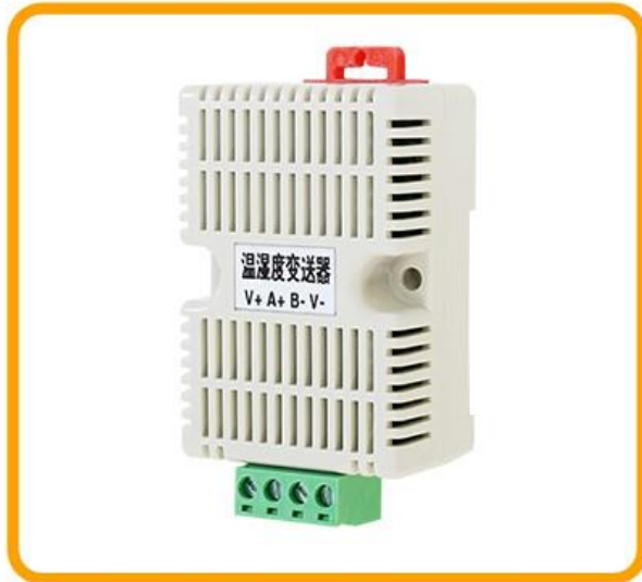
壁挂式温湿度传感器