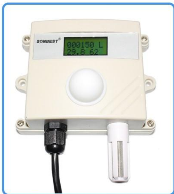
光照度及温湿度一体式 传感器