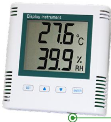
标配电源接入位置