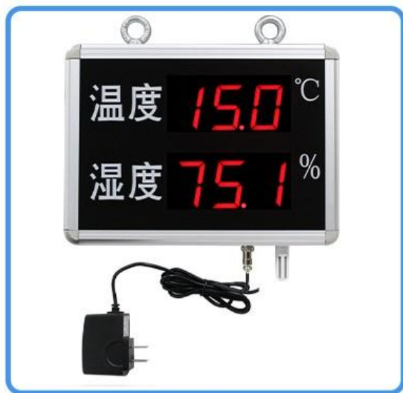
看板 (含DC12V 1A电源)