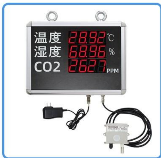
一套看板 (含电源及传感器)