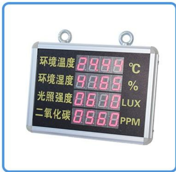
一套看板 (含电源及传感器)