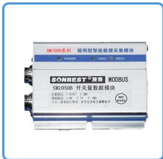
RS485接口开关量采集模块