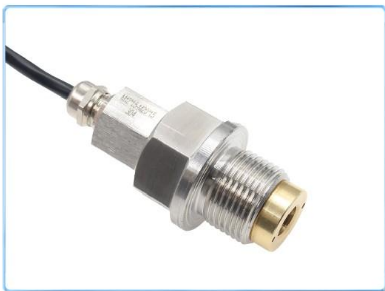
管道紫外线传感器1个 (实际以用户选配为准)