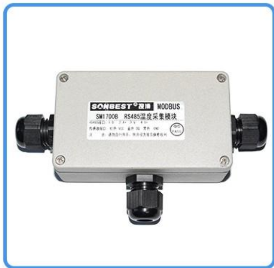
SM1700C CAN智能温度数据采集模块