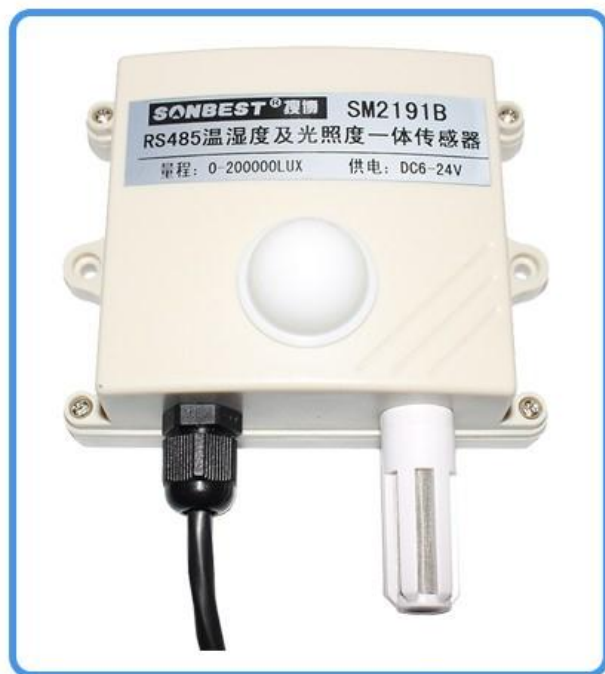
RS485接口光照度 及温湿度一体式传感器 (不含电源)