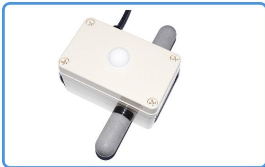
RS485接口二氧化碳、温度 湿度一体传感器