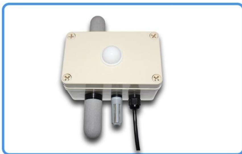
RS485接口二氧化碳、温度、湿度 光照度、大气气压一体式传感器