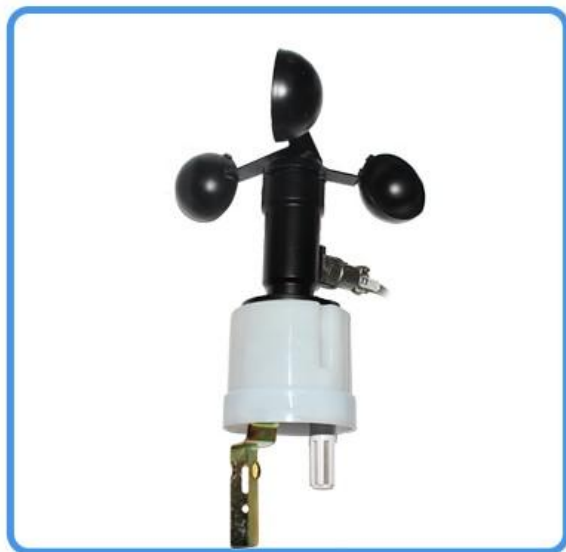
户外光照温湿度传感器 (不含电源 不含转换器)