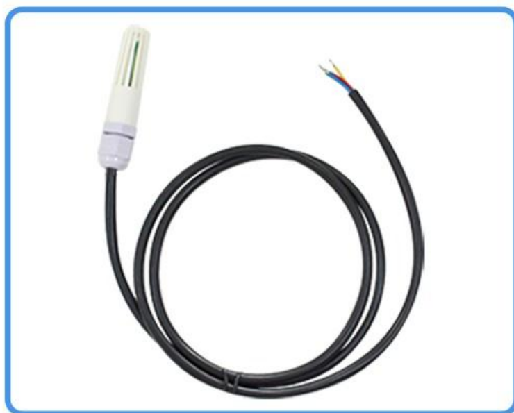
温湿度传感器 (根据用户选配发货)