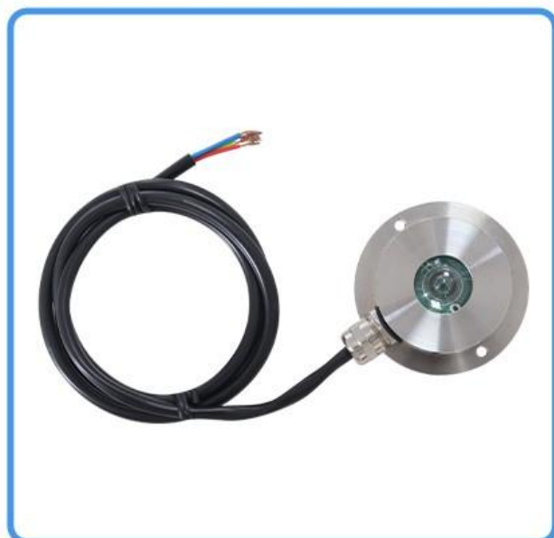
不锈钢光照度传感器 (无电源无转换器)