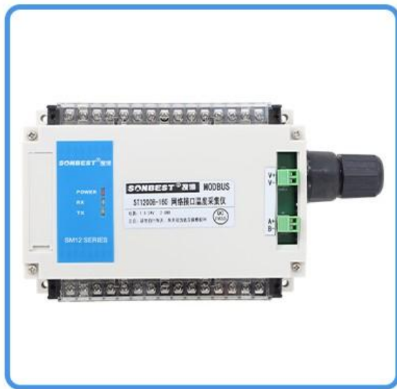
ST1200B-160 网络接口温度采集模块