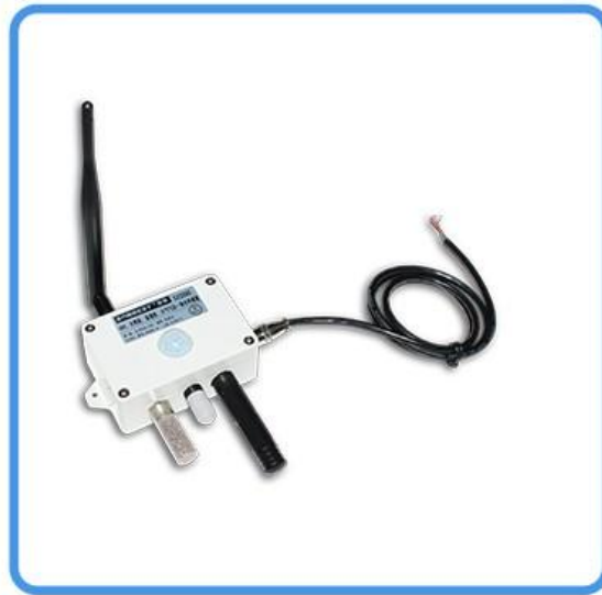
CO 2 、光照度、温湿度 大气气压一体式传感器 (根据用户选配发货)