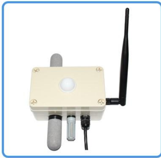
ZIGBEE无线二氧化碳传感器