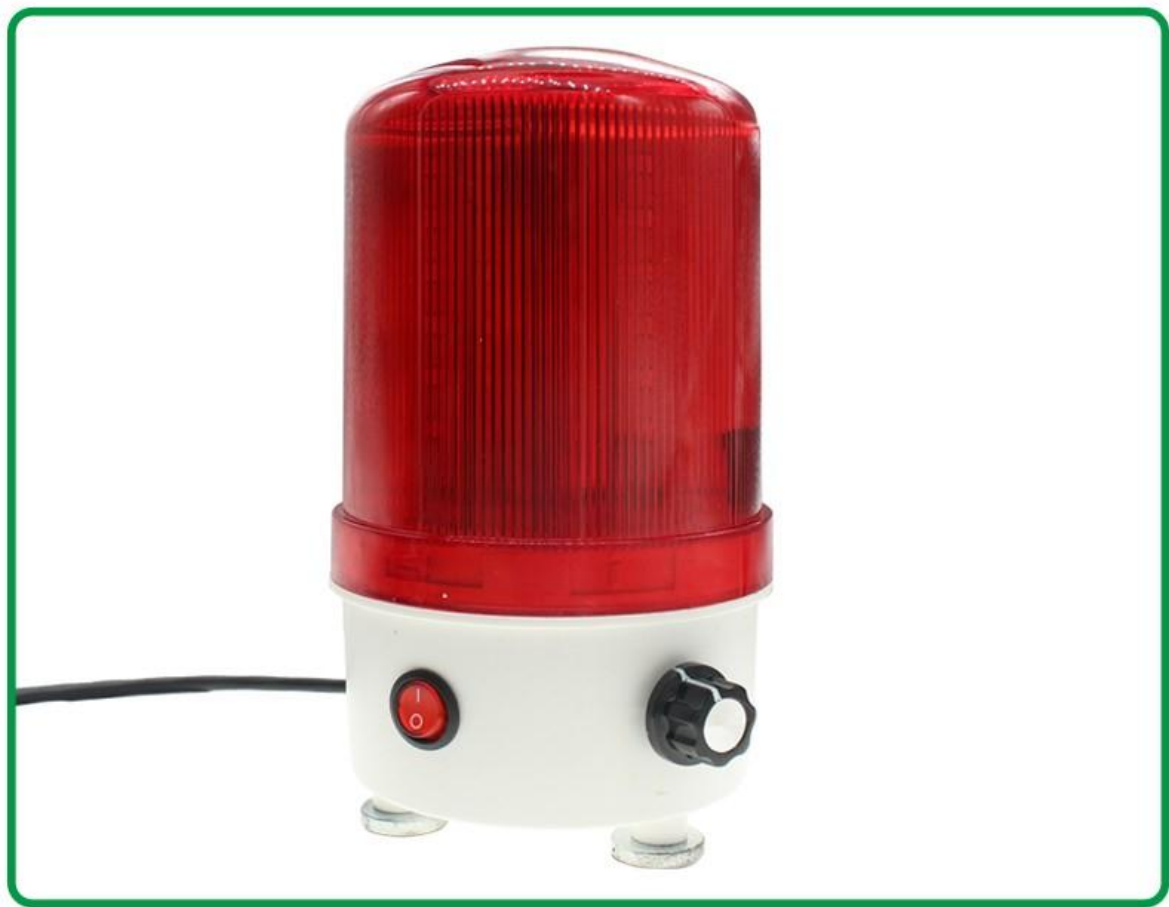
声光报警器 数量1个