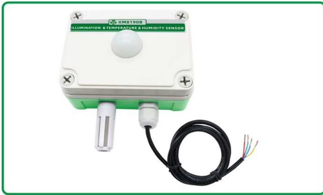
温湿度及光照度传感器1个 根据用户选配发货