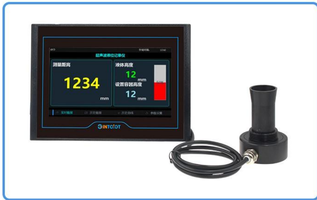
超声波液位记录仪（根据用户选配发货）